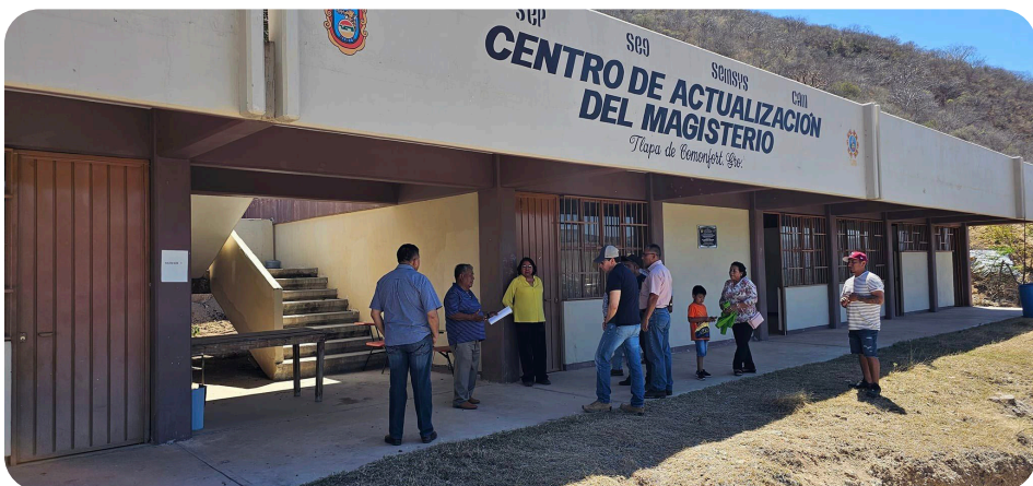
Atendimos la invitación de maestros del Centro de Actualización del Magisterio Tlapa (CAM), Una obra que les construimos el año 2015 y que requiere urgente mantenimiento, institución ubicada en la Comunidad de Barranca del Otate del Municipio de Tlapa, en próximas fechas les daremos atención a sus planteamientos.