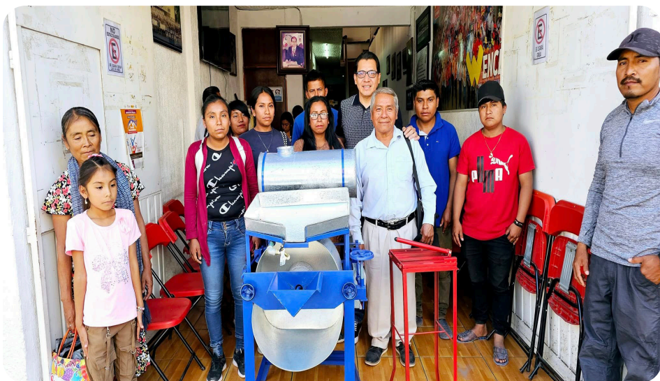
Entregamos de forma solidaria un molino para nixtamal al comité de padres de familia de la Esc. Prim. Bilingüe "Ignacio Zaragoza" de la Comunidad de Tenango Tepexi, Municipio de Tlapa de Comonfort, Gro. Que será utilizado en la cocina escolar en la preparación de tortillas en el programa alimentos calientes.