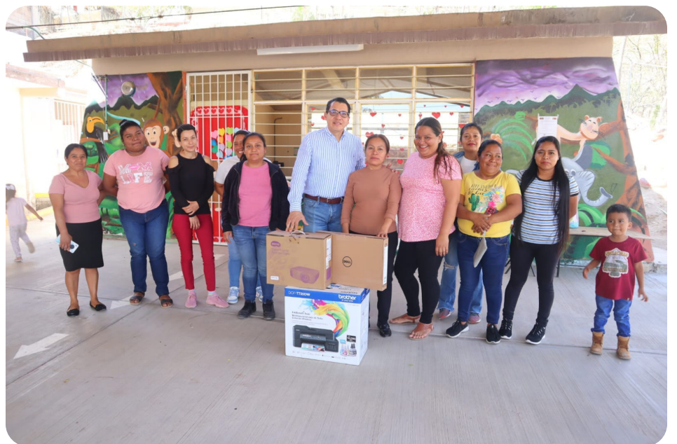
Le Entregamos Proyector, Computadora e impresora a la Compañera Directora del Preescolar "AKOJSEMALOTL" de la Colonia San Nicolás del Municipio de Tlapa de Comonfort, Gro.