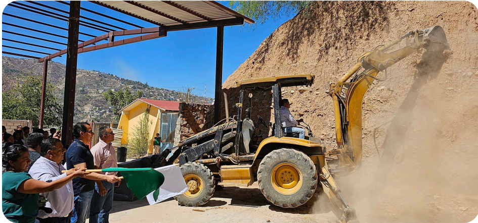
Se dio inicio con la Plataforma donde se Construirán 6 aulas para la Esc. Sec. "Lázaro Cárdenas" Col. Emiliano Zapata, Municipio de Tlapa de Comonfort, Gro.

VICTORIANO WENCES REAL Comisionado Político Nacional del PT en el Estado de Guerrero