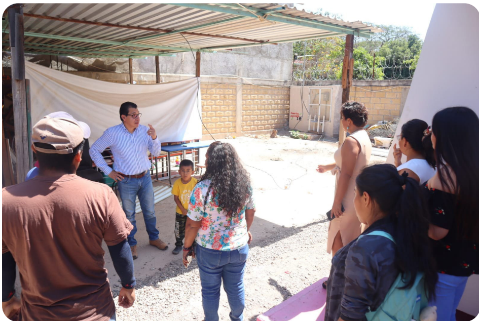
Se apoyó con 5 toneladas de cemento al Preescolar "Gabriel González Pineda" de la Colonia Caltitlán del Municipio de Tlapa de Comonfort, Gro. Continúan con las mejoras de dicha institución.